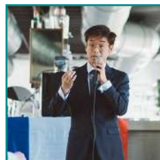
Joachim SON-FORGET Député Parlement français