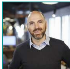
Olivier BOUSQUET Chef de la recherche en machine learning Google