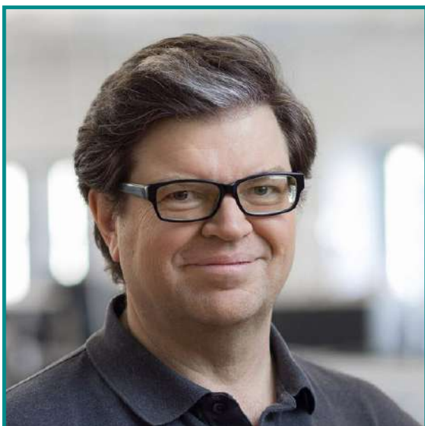
Yann LECUN Vice-président & directeur scientifique de l'intelligence artificielle Facebook

Le premier Empowerment Summit peut compter sur la présence d'experts internationaux qui partageront et échangeront leur point de vue sur l'intelligence artificielle et les défis qu'elle pose à notre société.